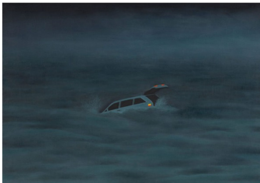
Alexandra Noel, Ship Spotting , 2018

À l'instar des toiles rangées dans la catégorie « art naïf », les peintures de cette californienne née en 1989 sont minutieuses et recouvertes de couleurs vives souvent appliquées en aplats. Par leur taille et leurs dégradés, elles évoquent des bijoux dans la nuit et des écrans de téléphone ou d'ordinateurs. Proposant un gros plan sur une bouche de bébé ou sur un paysage cosmique, utilisant des micro-toiles ou des formats plus standards, Alexandra Noel se joue en fait des échelles et de l'élasticité des images. Tirant ses sujets de son imaginaire, de photos personnelles ou de visuels glanés ici et là, elle copie, colle, reproduit, zoome et dézoome comme le font nos doigts et nos souris à la surface d'interfaces numériques.