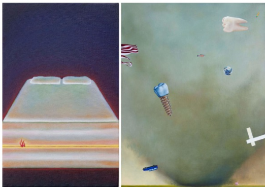
Alexandra Noel, À gauche: Money Mattress (2016); à droite : And then the air was filled with 10,000 things (or when a minor piece of wood becomes a missile) (2019)

À travers les yeux d'Alexandra, ce chaos s'organise et a la saveur d'une Amérique brumeuse et mélancolique. Élevée en banlieue à San Diego et basée en périphérie de Los Angeles, l'artiste égraine à dessein des sentiments d'inertie et de vide à la surface de ses tableaux. En témoignent les voitures isolées, les larges ciels et les architectures rigides qui les peuplent. Une menace invisible mais omniprésente pèse et se dissout dans une forme de mysticisme contemplatif.