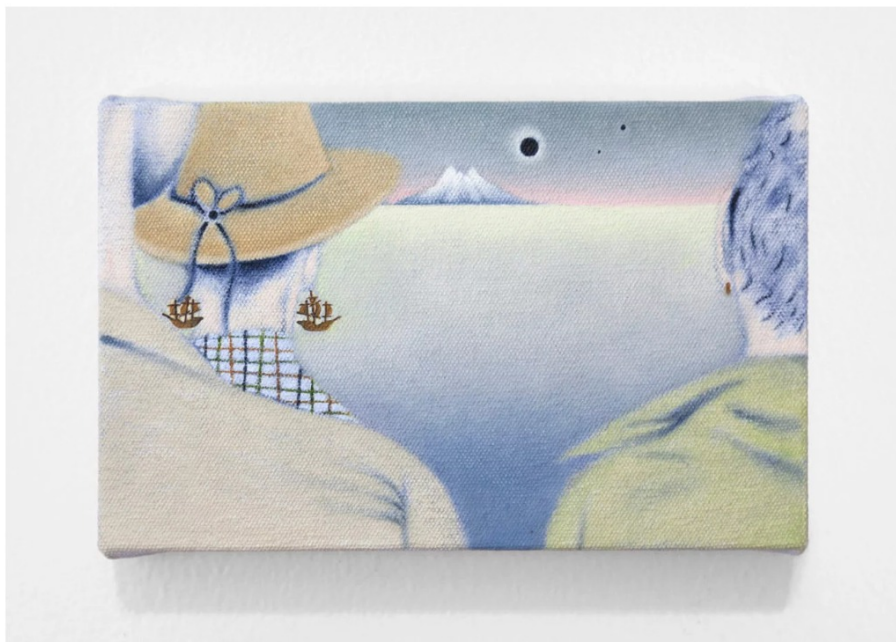
Alexandra Noel, Waiting for more land , 2017

Aux toutes petites toiles peintes d'Alexandra Noel, on a envie de chuchoter des secrets... Elles sont comme des bijoux dans la nuit, des images prélevées d'un rêve ou d'un écran, et parachutées dans notre monde. À l'heure où proliférations visuelles en tout genre régissent notre appréhension du réel, immersion dans un univers qui sonde nos psychés angoissées.